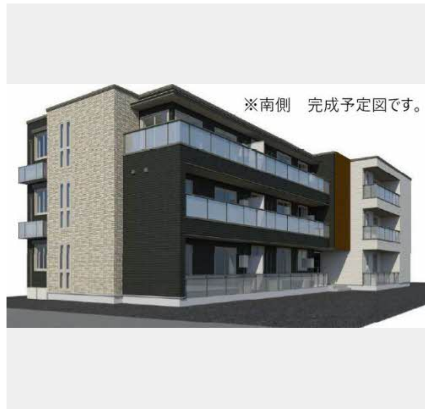
※南側 完成予定図です。