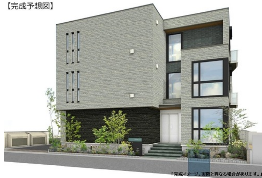
【完成イメージ。実際と異なる場合があります。】