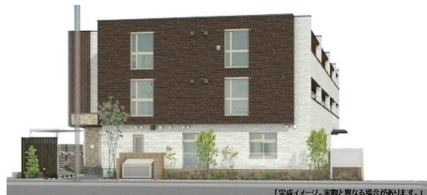
「完成イメージ。実際と異なる場合があります。」