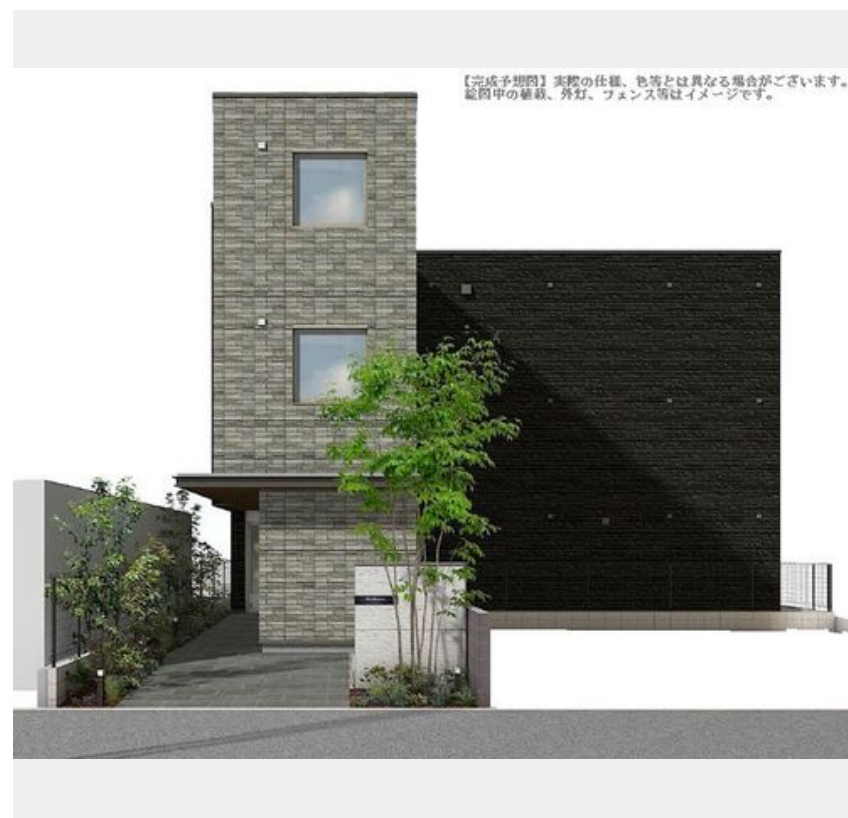
【完成予想図】実際の仕様、色等とは異なる場合がございます。配管中の給排水、電気、ガス等はイメージです。