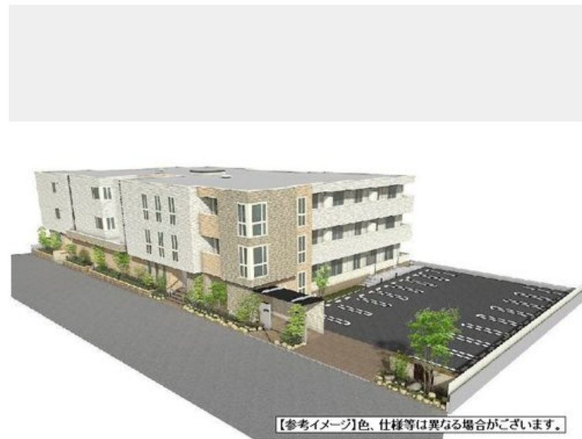
【参考イメージ】色、仕様等は異なる場合がございます。