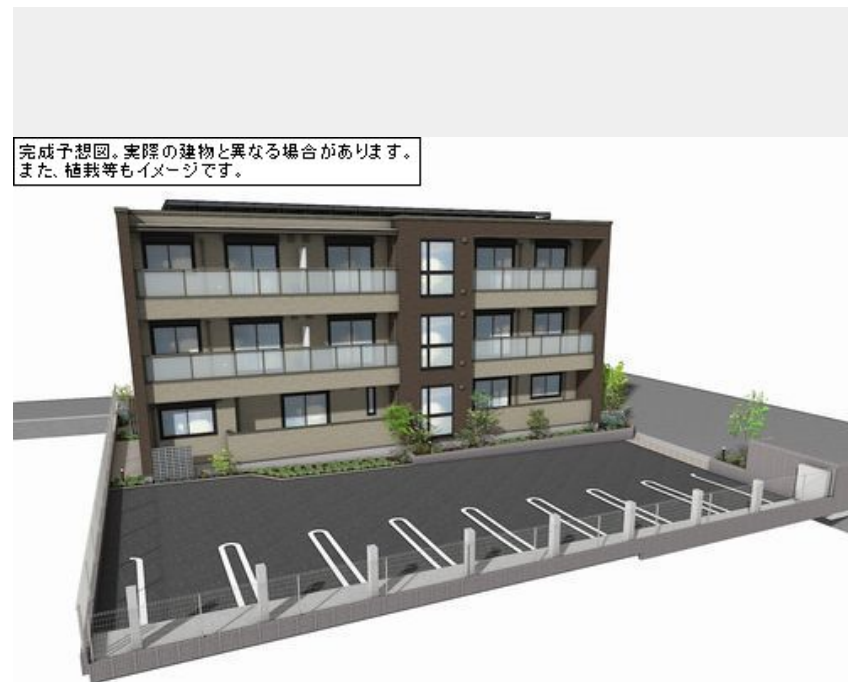
完成予想図。実際の建物と異なる場合があります。また、植栽等もイメージです。