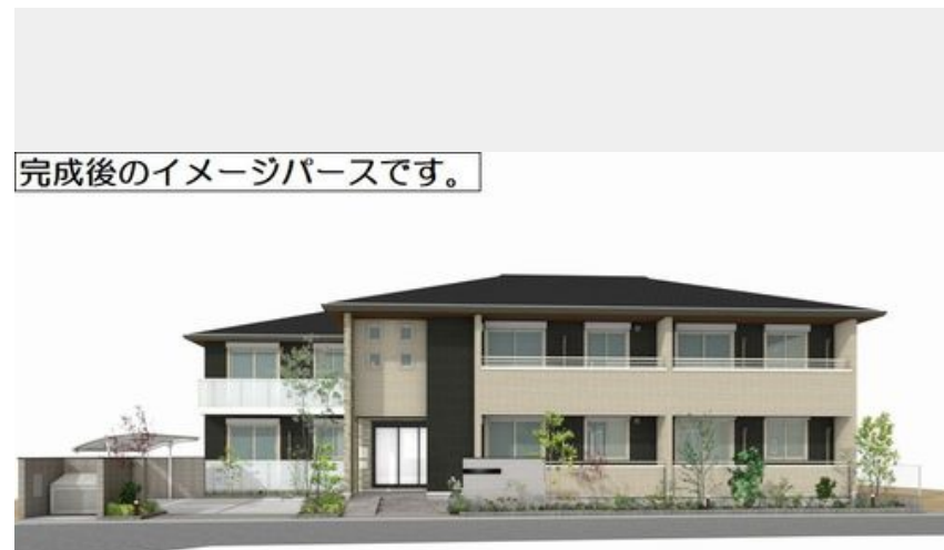
完成後のイメージパースです。