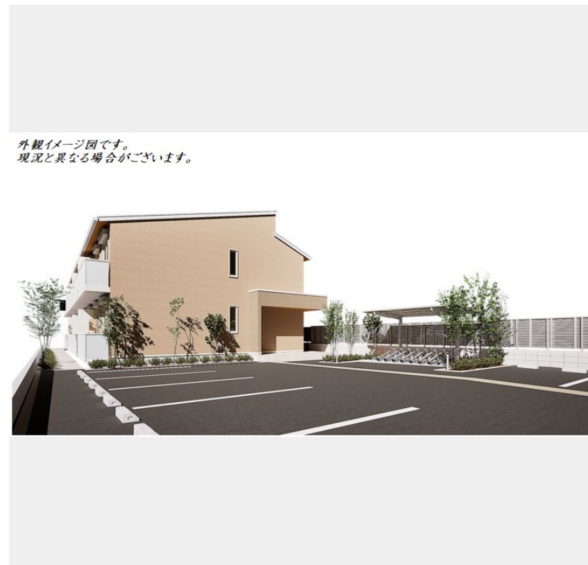
外観イメージ図です。 現況と異なる場合がございます。