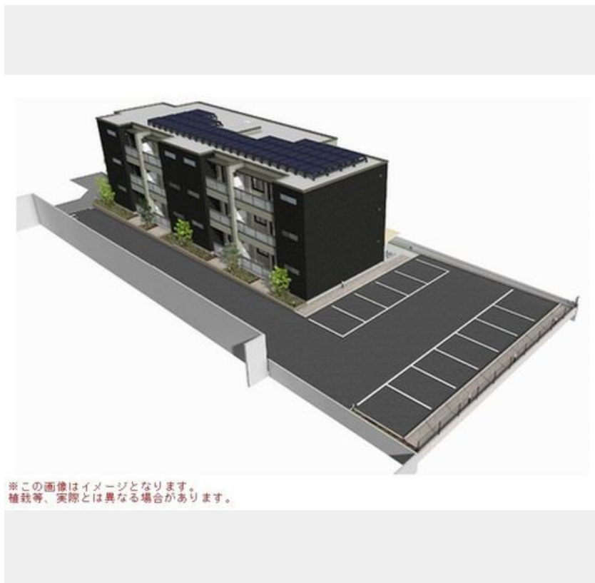
※この画像はイメージとなります。植栽等、実際とは異なる場合があります。