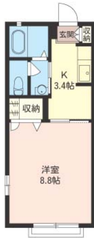
積水ハウスの賃貸住宅 シャーメゾン