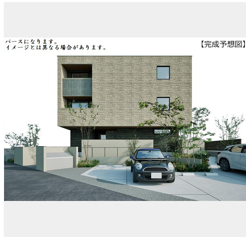
パースになります。イメージとは異なる場合があります。