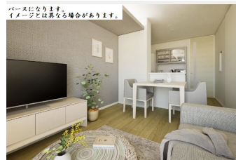
パースになります。イメージとは異なる場合があります。