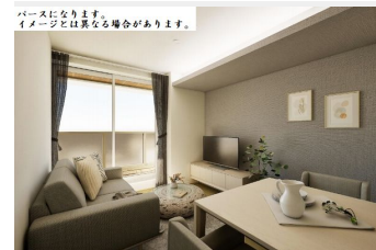
パースになります。イメージとは異なる場合があります。