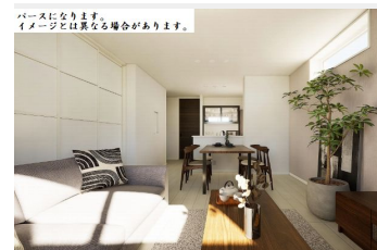
パースになります。イメージとは異なる場合があります。