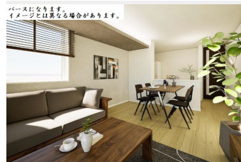
パースになります。イメージとは異なる場合があります。