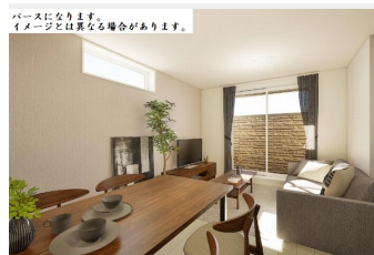
パースになります。イメージとは異なる場合があります。