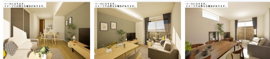
パースになります。イメージとは異なる場合があります。