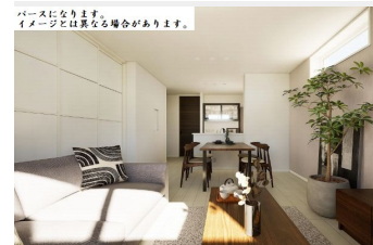
パースになります。イメージとは異なる場合があります。