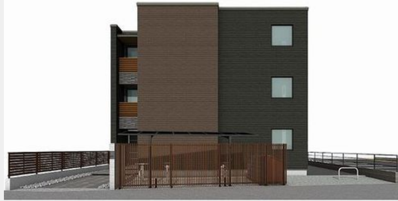
【建物完成予想図】 実際の仕様・外観とは異なる場合があります。 絵図中の駐輪場・ゴミ置き場などはイメージです。