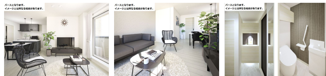
パースとなります。イメージとは異なる場合があります。