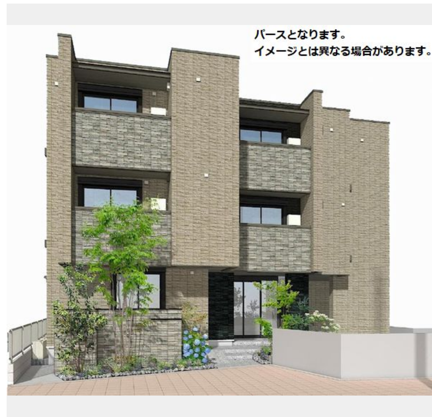
パースとなります。 イメージとは異なる場合があります。