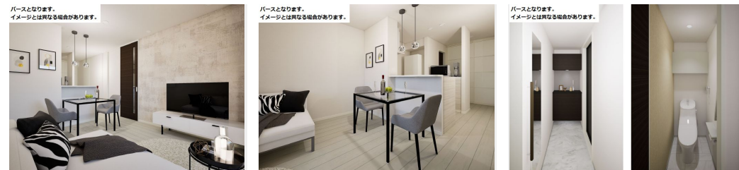
パースとなります。 イメージとは異なる場合があります。