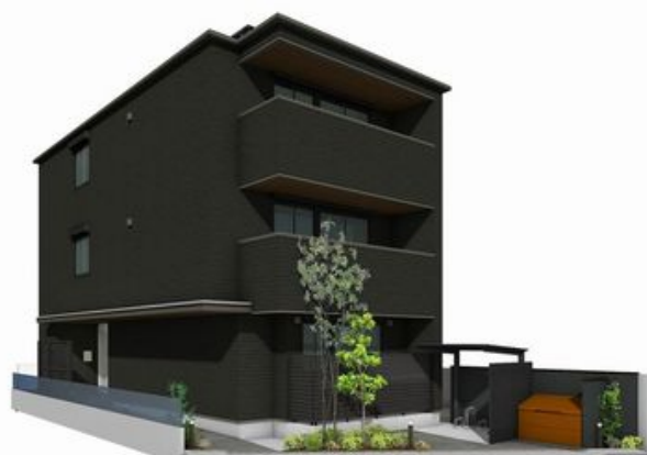
【外観イメージ】実際の仕様・設備とは異なる場合があります。図中の植栽、ごみ置き場、駐輪場はイメージです