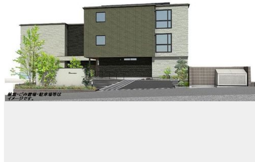
緑地・ごみ置場・駐車場等はイメージです。