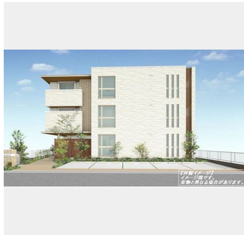
【写真イメージ】イメージ図です。実物と異なる場合があります。