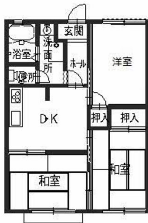
積水ハウスの賃貸住宅 シャーメゾン