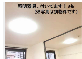
照明器具、付いてます！3基 (※写真は別物件です)