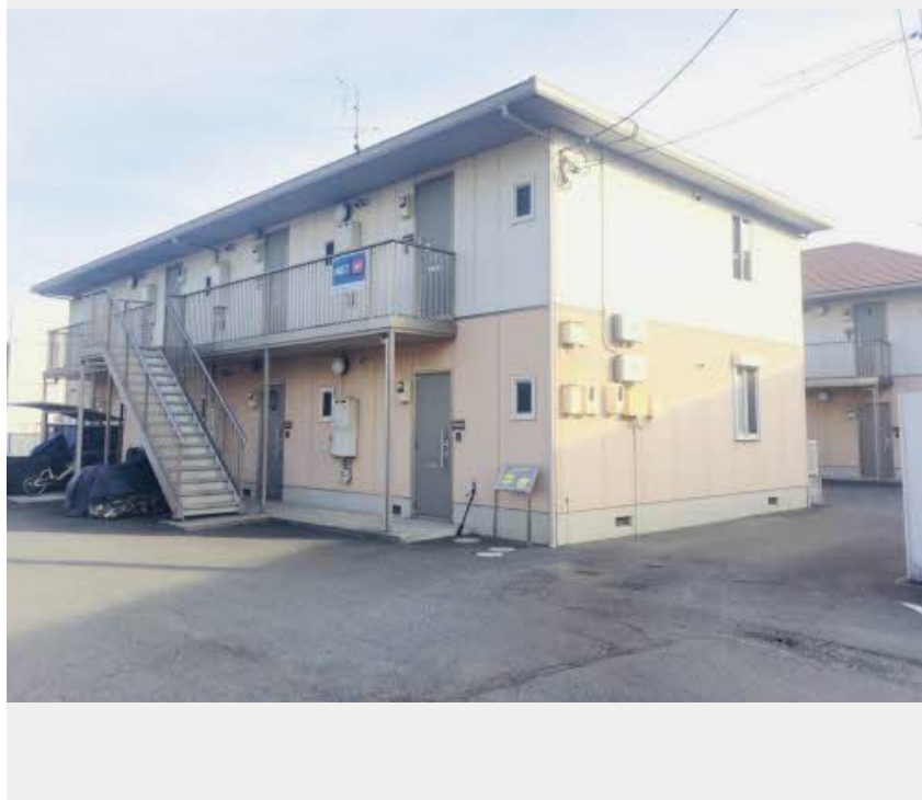
照明器具、付いてます！(2基) (※写真は別物件です)