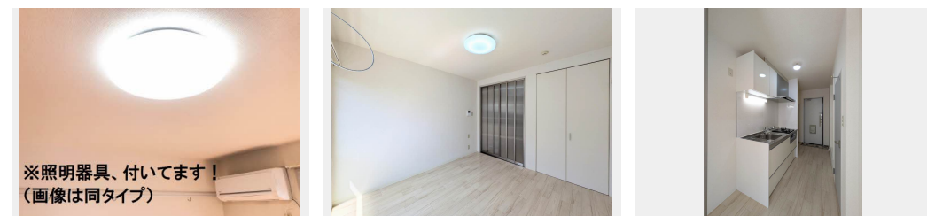
※照明器具、付いてます！ (画像は同タイプ)