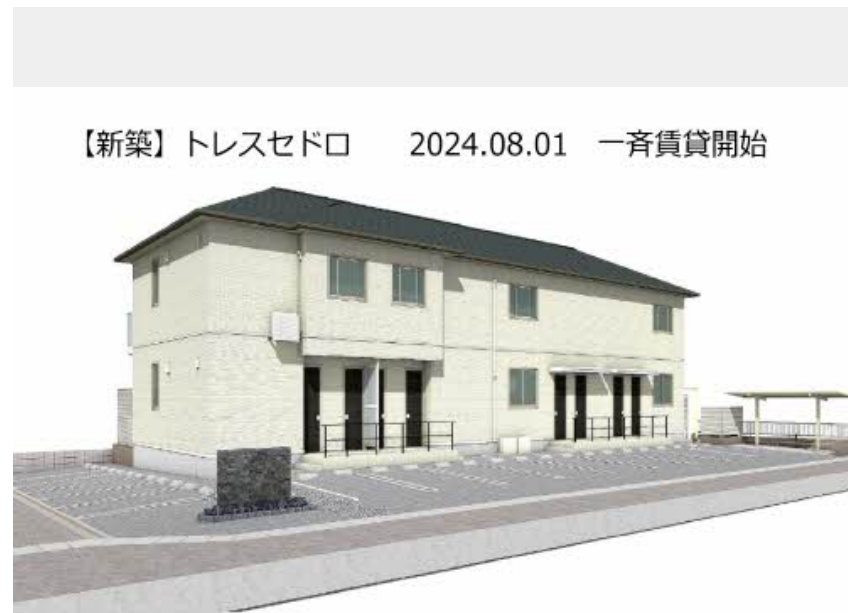
【新築】トレスセドロ 2024.08.01 一斉賃貸開始

掲載のイメージイラスト等は、計画段階の図面を基に書き起こしたものであり、設計・施工上の理由により変更となる場合があることをご了承下さい。