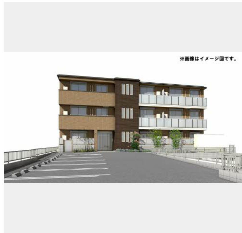
※画像はイメージ図です。