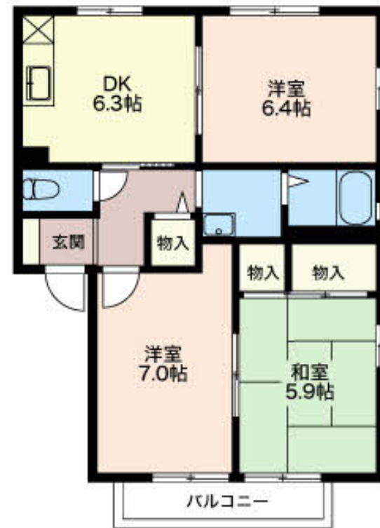
積水ハウスの賃貸住宅 シャーメゾン