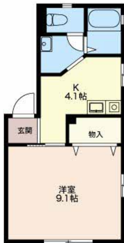
積水ハウスの賃貸住宅 シャーメゾン