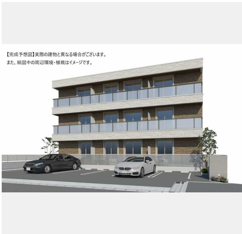
【完成予想図】実際の建物と異なる場合がございます。 また、絵图中的の周辺環境・植栽はイメージです。