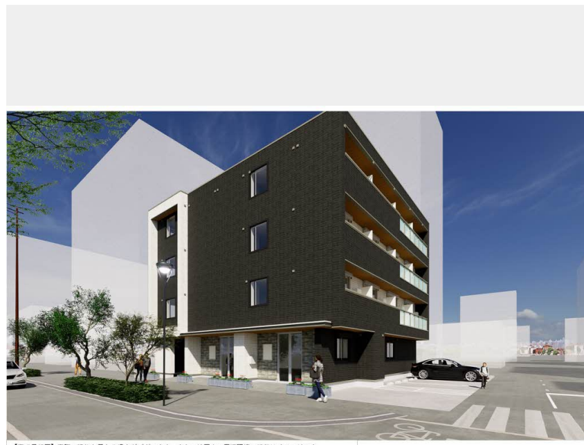
【完成予想図】実際の建物と異なる場合がございます。また、絵图中的周辺環境・景観はイメージです。