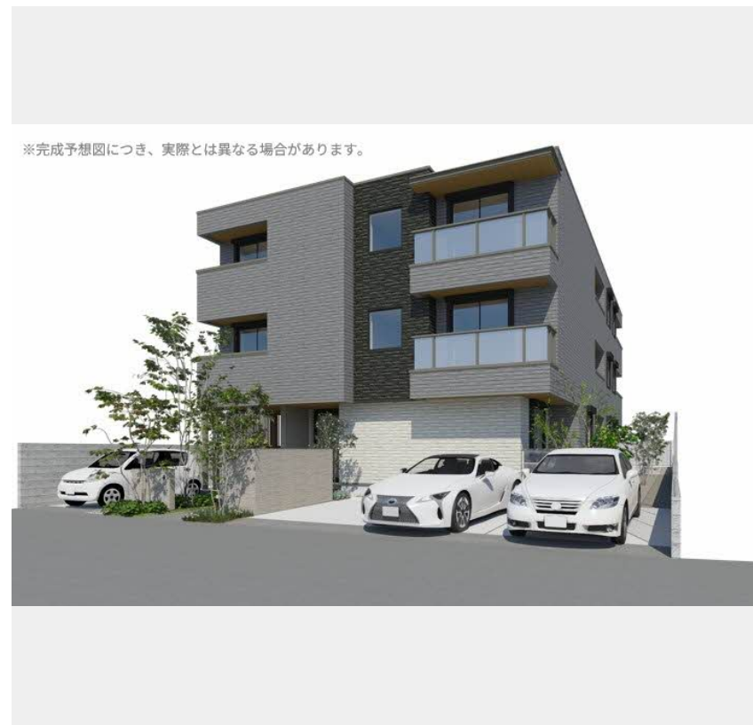
※完成予想図につき、実際とは異なる場合があります。