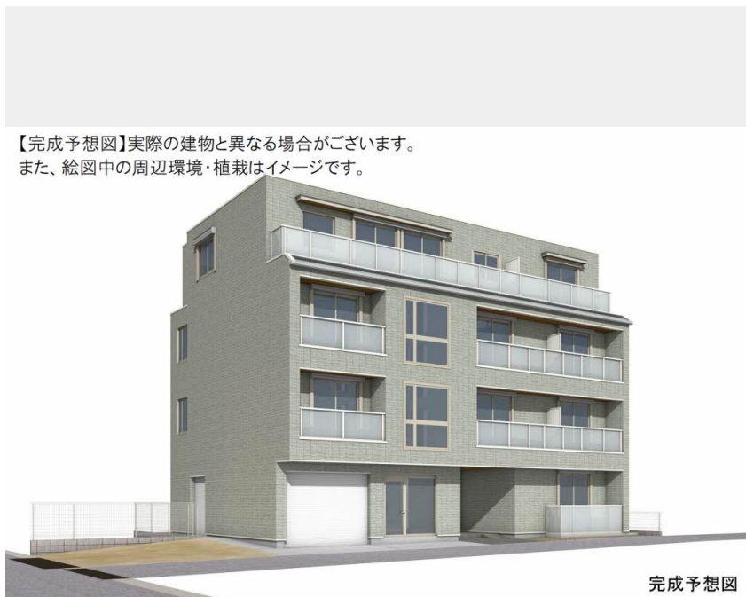
【完成予想図】実際の建物と異なる場合がございます。また、絵図中の周辺環境・植栽はイメージです。 完成予想図