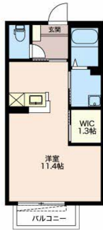
積水ハウスの賃貸住宅 シャーメゾン