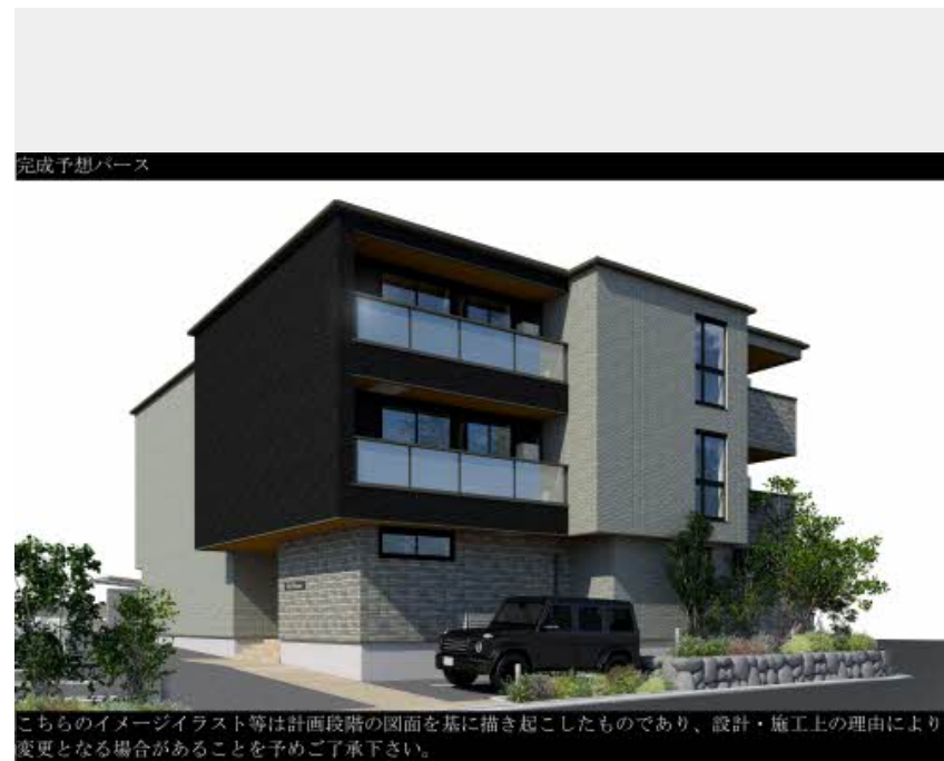
完成予想パース こちらのイメージイラスト等は計画段階の図面を基に描き起こしたものであり、設計・施工上の理由により変更となる場合があることを予めご了承下さい。