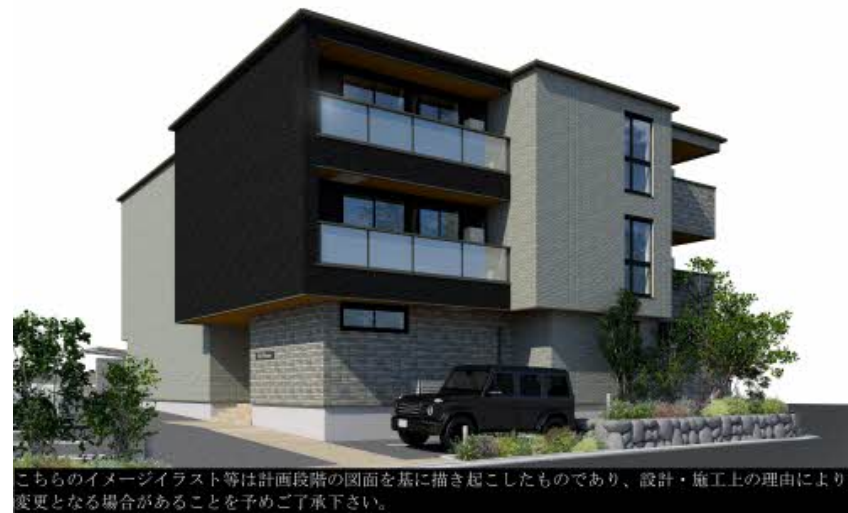
こちらのイメージイラスト等は計画段階の図面を基に描き起こしたものであり、設計・施工上の理由により変更となる場合があることを予めご了承下さい。