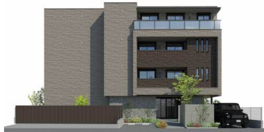
掲載のイメージ等は計画段階の図面を基に描き起こしたものであり、設計・施工上の理由により変更となる場合がございます。