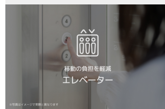
移動の負担を軽減 エレベーター