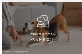
大切な家族とともに ペット相談可