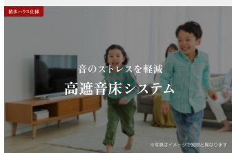
音のストレスを軽減 高遮音床システム