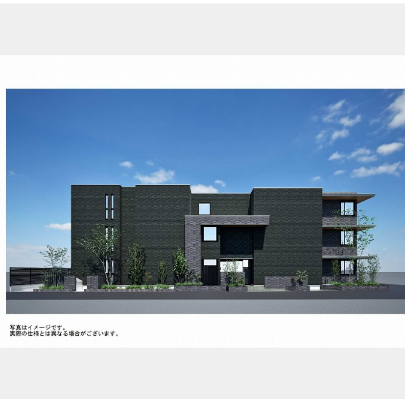
写真はイメージです。実際の仕様とは異なる場合がございます。