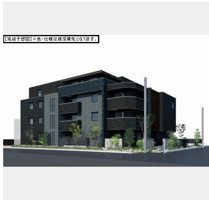
【完成予想図】※色・仕様は現況優先となります。