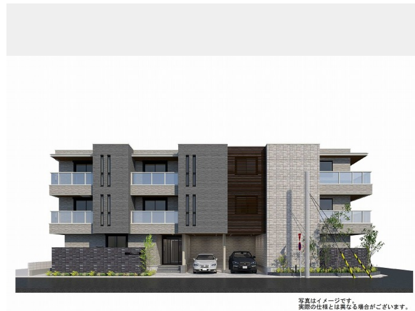
写真はイメージです。実際の仕様とは異なる場合がございます。