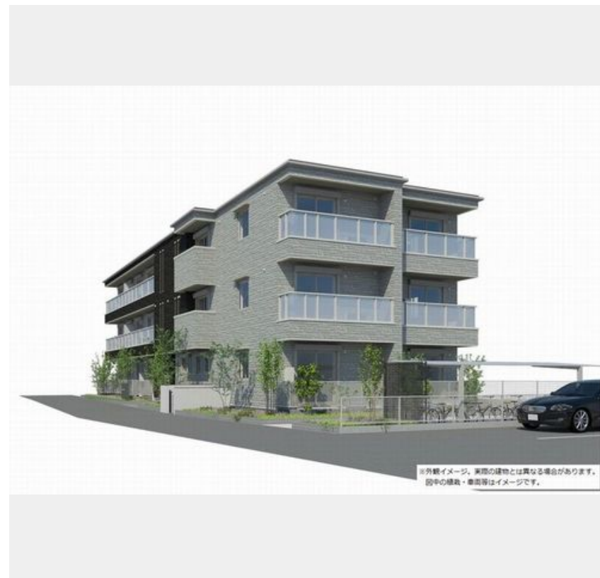
※外観イメージ。実際の建物とは異なる場合があります。途中の構造・業態等はイメージです。