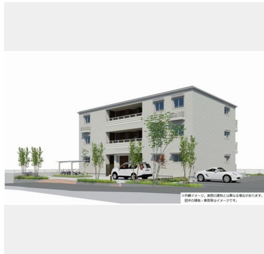
※外観イメージ。実際の建物とは異なる場合があります。図中の植栽・車庫等はイメージです。