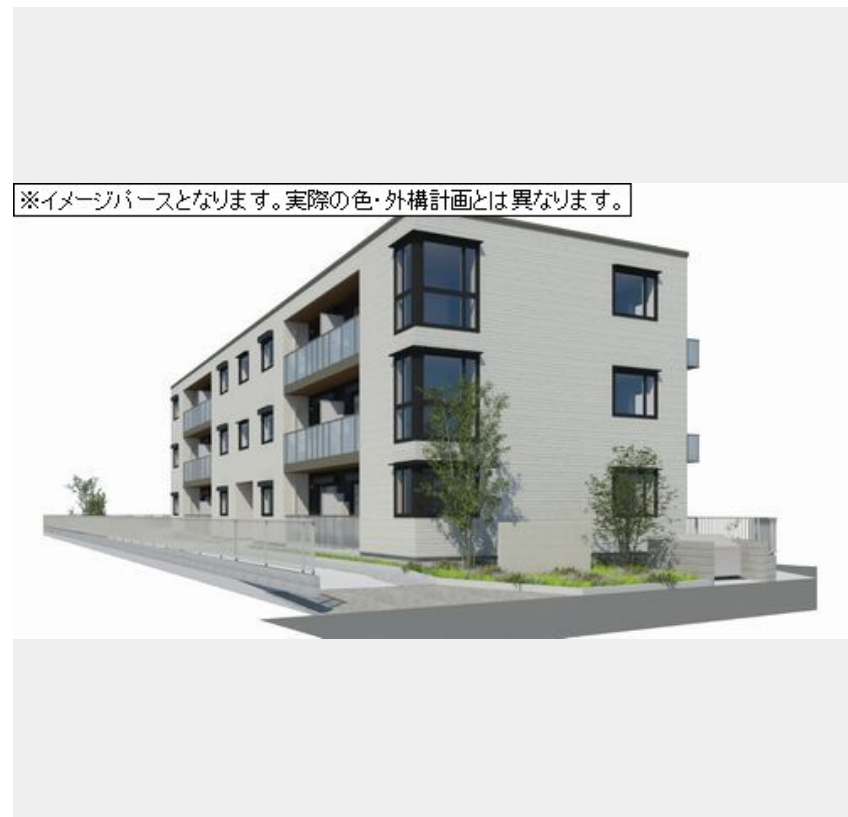
※イメージパースとなります。実際の色・外構計画とは異なります。