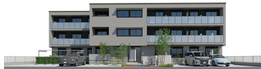
外観イメージバースです。実際の完成現場とは配置・配色・仕様等異なる場合がございます。