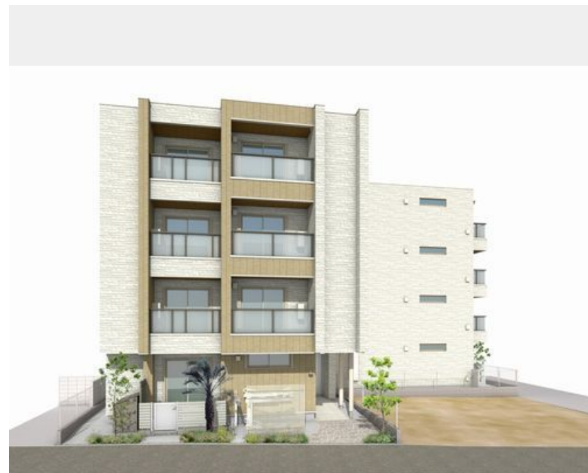
外観イメージです。色・外観・仕様につきましては変更となる場合がございます。