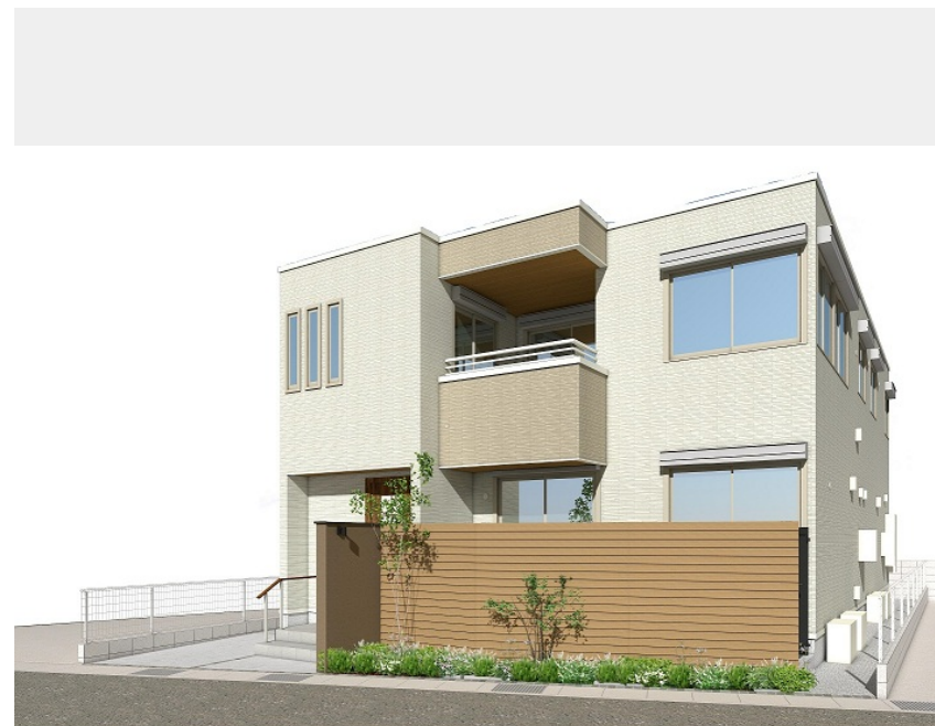
外観イメージです。実際の完成現場とは配置、配色、仕様等異なる場合がございます。