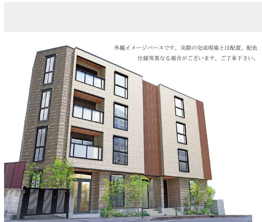
外観イメージパースです。実際の完成現場とは配置、配色仕様等異なる場合がございます。ご了承下さい。